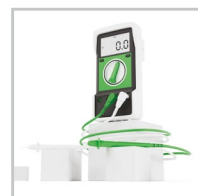
Urządzenia testowe i pomiarowe

Współpracujemy z najlepszymi i ciągle poszerzamy naszą ofertę o nowe produkty