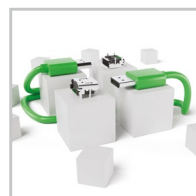
Złącza i przewody